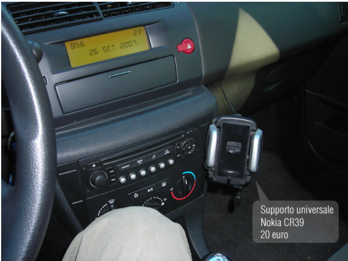
Supporto universale Nokia CR39 20 euro